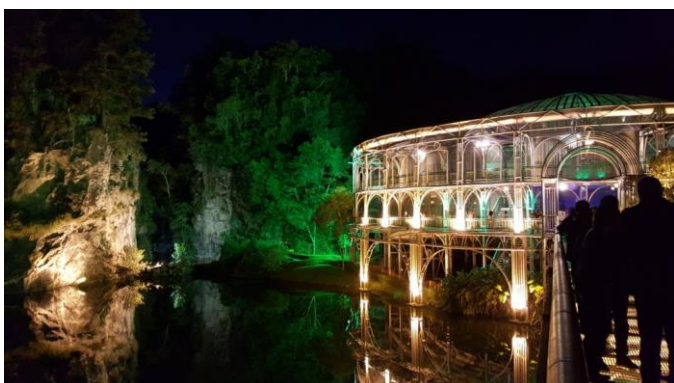
Opera de Arame Curitiba