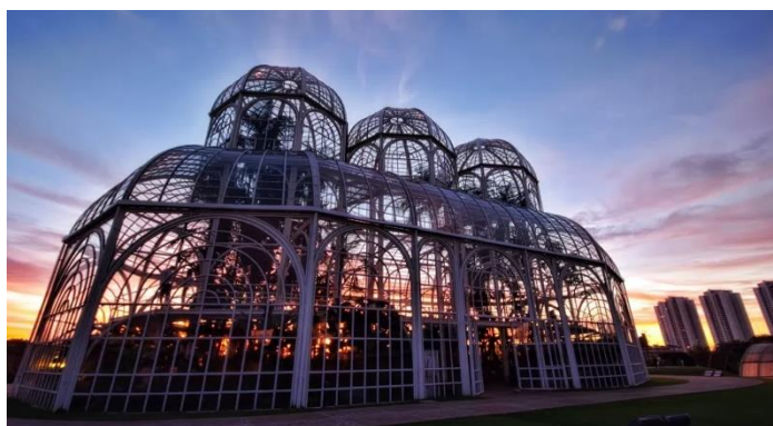
Jardim Botânico Curitiba